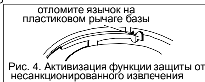
Рис. 4. Активизация функции защиты от несанкционированного извлечения

При необходимости защиты извещателя от несанкционированного извлечения или для обеспечения надежного крепления при наличии вибрации перед установкой базы произведите операции в соответствии с указаниями на рис. 4. Для снятия извещателя после активизации функции защиты отверткой с узким плоским шлицем отожмите пластиковый рычаг к центру базы через прямоугольное отверстие между базой и извещателем.