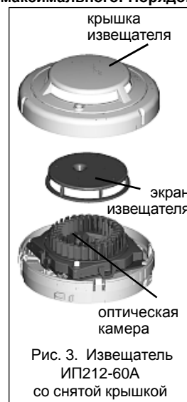
Рис. 3. Извещатель ИП212-60А со снятой крышкой

Также тестирование можно провести при использовании МПДУ и ИКР в соответствии с Руководством по их использованию I56-1720-003RU, при этом можно считать уровень загрязнения дымовой камеры, уровень чувствительности, дату последнего технического обслуживания и дату выпуска извещателя и т.д. Для тестирования датчиков рекомендуется использовать генераторы дыма, например, устройства фирмы "No Climb Products Ltd" с аэрозольными имитаторами дыма "Solo 330 Smoke Dispenser", "Trutest". Извещатели, не прошедшие тестирования, должны быть почищены в соответствии с указаниями раздела «ТЕХНИЧЕСКОЕ ОБСЛУЖИВАНИЕ» и протестированы повторно. Извещатели, не прошедшие повторное тестирование, должны быть отправлены в ремонт. После проверки всех извещателей уведомите соответствующие службы о том, что данная система введена в эксплуатацию.