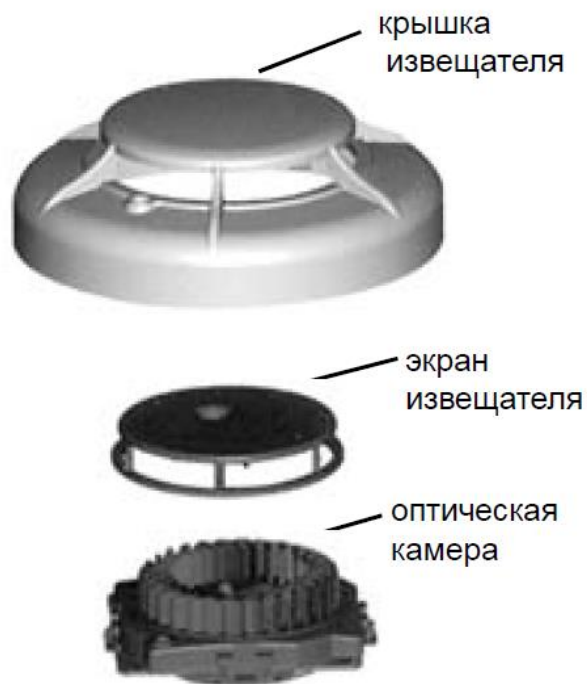
Рис.2. Извещатель ИП212-58М со снятой крышкой